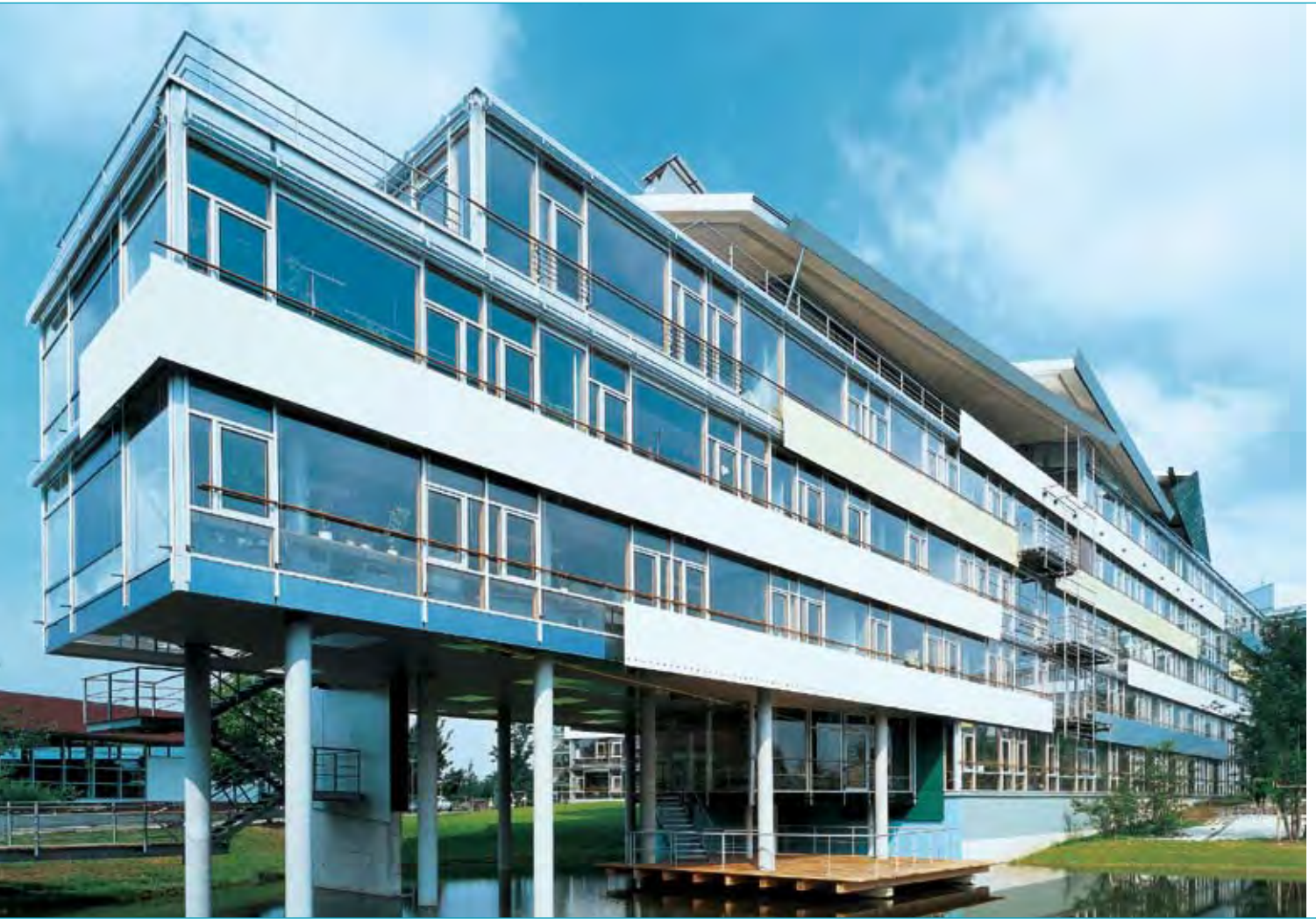
Im Gebäude der Landesversicherungsanstalt Lübeck zeigen ALLSTOP®-Gläser das Thema Sicherheit von seiner transparenten Seite.